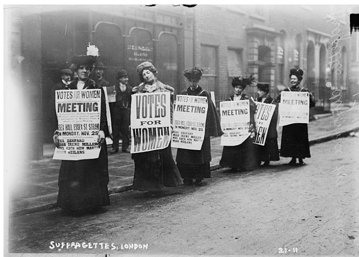
Fig. 1.1: Mujeres exigiendo el derecho al voto en Londres, hacia fines del siglo XIX

A principios del siglo XIX Portugal y España introdujeron el sufragio de los hombres propietarios. En 1829 sucedió lo mismo en Italia. Las revoluciones europeas de 1848 provocaron más cambios. En Francia se reinstauró el sufragio universal de los hombres y en Suiza se adoptó el mismo sistema.