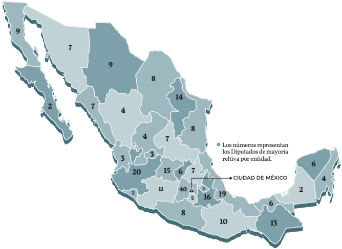
Fig. IV.1: Diputados por entidad federativa en México (ilustración de Omar Hernández)

En el caso de México, la ley postula que el mínimo de distritos electorales por estado es dos (como en el caso de Colima). El resto de los distritos se distribuye entre los estados faltantes utilizando el algoritmo de Hare-Niemeyer, que explicamos en la sección V.